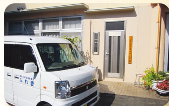
居宅介護支援事業所 ふれあい