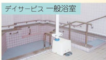
デイサービス 一般浴室