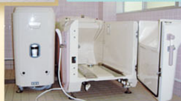
デイサービス 機械浴