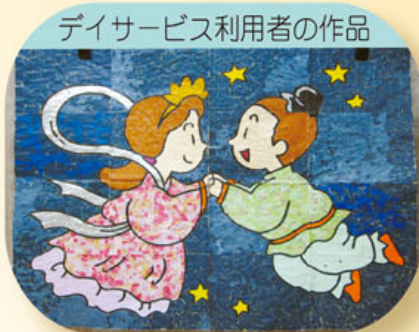
デイサービス利用者の作品

は、特別養護老人ホーム（定員50名）への入所のほか、居宅サービスとして短期入所（ショートステイ）定員5名/日、通所介護（デイサービス）、居宅介護支援（在宅のケアマネージャー）の事業を行っている施設です。